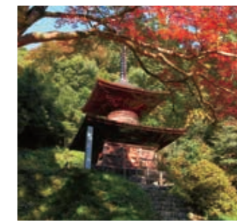
金鑽神社多宝塔 国指定重要文化財

金鑽神社境内にあり、三間四面、柿葺き、高さ約14m、総朱塗り。天文3年(1534年)、武蔵七党で名高い安保弾正全隆が子孫の多幸を祈るために建立したものです。