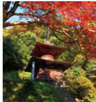
金鑽神社多宝塔 国指定重要文化財

金鑽神社境内にあり、三間四面、柿葺き、高さ約14m、総丈塗り。天文3年(1534年)、武蔵七党で名高い安保弾正全隆が子孫の多幸を祈るために建立したものです。