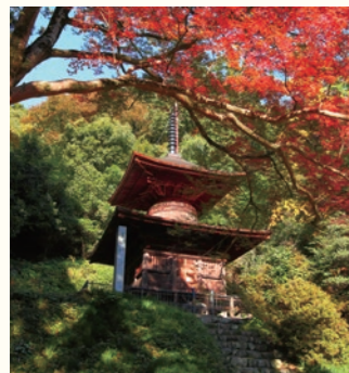
御嶽の鏡岩 国指定特別天然記念物

岩断層活動のすべり面で、摩擦によって表面が鏡のように磨かれています。岩質は赤鉄石英片岩で、岩面の大きさや、断層の方向が分かっていることから地質学的に貴重な露頭となっています。